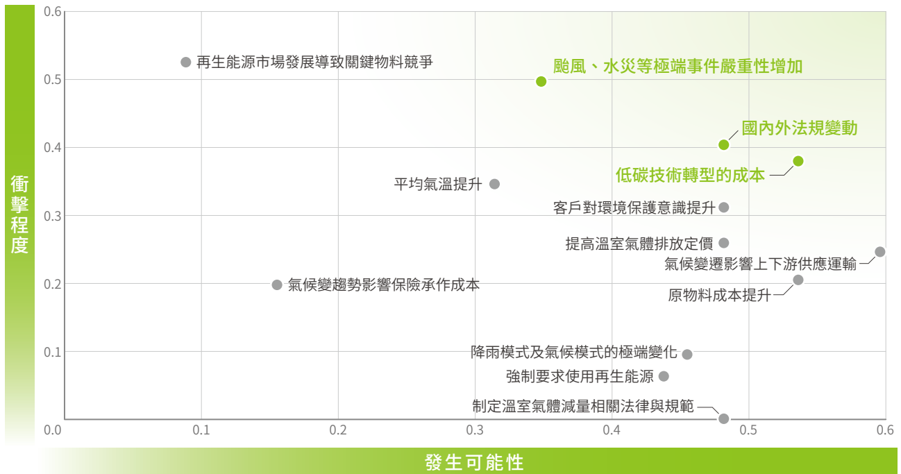
氣候變遷機會矩陣